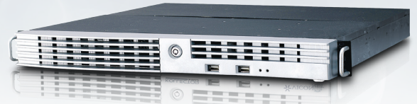
Servidor Montaje de Rack

El control de Acceso Vicon (VAX) es un sistema con todas las funciones basadas en credenciales que puede ser instalado en un PC o pre instalado en un servidor certificado por Vicon. Se puede acceder y controlar por un navegador web estándar en una red de área local, por Internet o por red inalámbrica. No se requiere ninguna instalación de software para acceder al sistema. Es totalmente compatible con el Sistema de Gestión de Vídeo ViconNet® y la combinación de los dos ofrece una solución completa para aplicaciones de control de acceso y vigilancia por vídeo de sistemas convencionales a sistemas muy grandes.